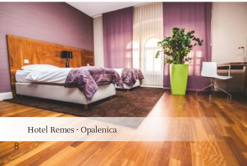
Hotel Remes - Opalenica