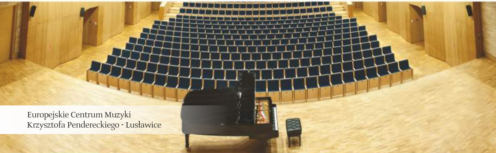
Europejskie Centrum Muzyki Krzysztofa Pendereckiego - Lusławice