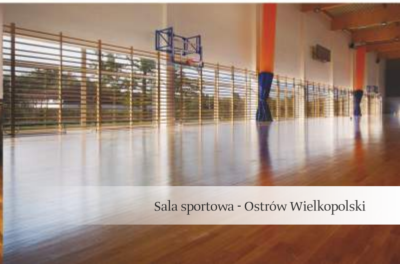
Sala sportowa - Ostrów Wielkopolski