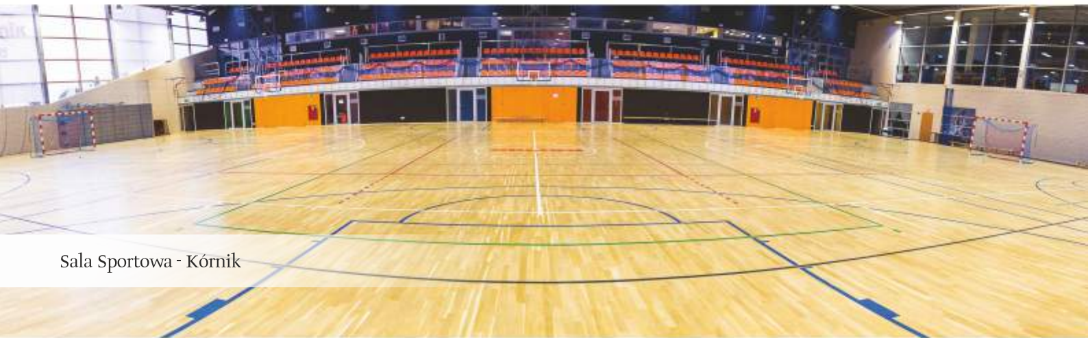
Sala Sportowa - Kórnik